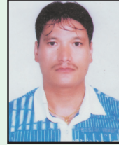
बसन्त महर्जन सदस्य