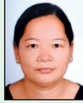
बेली मैया घले उपाध्यक्ष