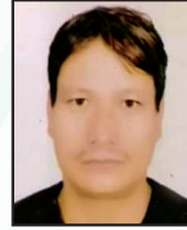
बसन्त महर्जन सदस्य