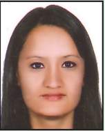
बालकुमारी गोपाली कनिष्ठ सहायक