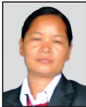
बेली मैया घले संयोजक