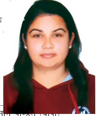
नामु बाइसे (पाना) संयोजक लेखा समिति

अन्तमा यस समितिलाई आवश्यक सहयोग प्रदान गर्नुहुने संचालक अधिकृत तथा सम्पूर्ण कर्मचारीहरुलाई हार्दिक धन्यवाद